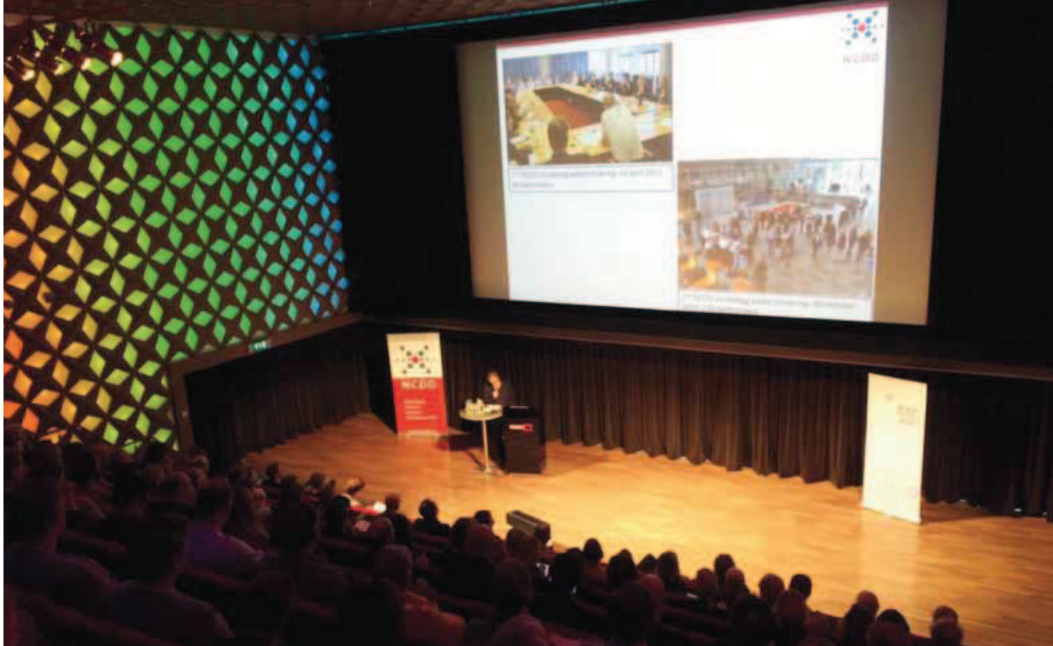
Studiedag 'Een web van webarchieven' op 17 november 2016.