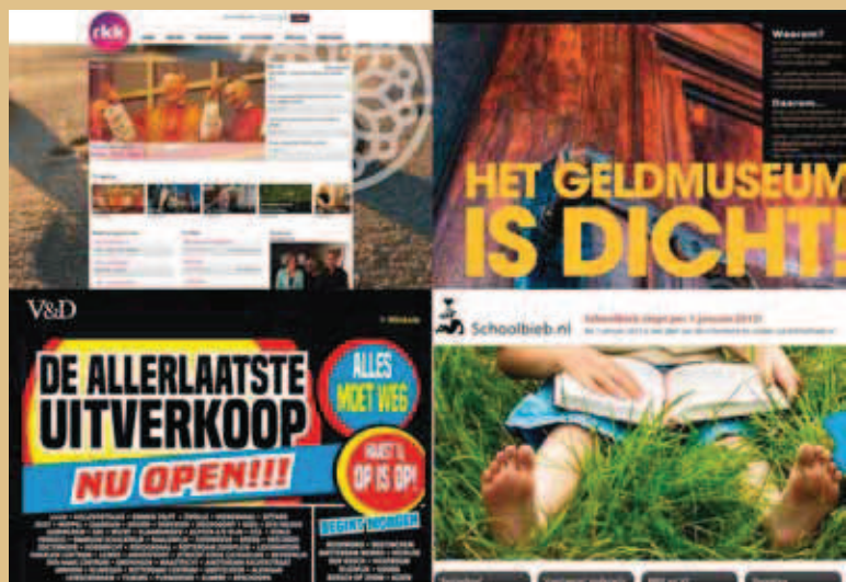
Verdwenen websites. Van linksboven naar rechtsonder: de website van de omroep RKK (collectie Beeld en Geluid), de website van het Geldmuseum (collectie Koninklijke Bibliotheek – KB), de website van warenhuis V&D (collectie KB) en de website van Schoolbieb (collectie KB).

Hoewel steeds meer gemeenten, overheidsinstellingen, musea en kennisinstituten starten met het archiveren van de delen van het internet die voor hen relevant zijn, vormen zij nog steeds een relatief kleine groep. Ook daar waar webarchivering